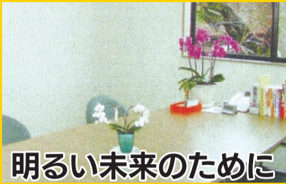
明るい未来のために